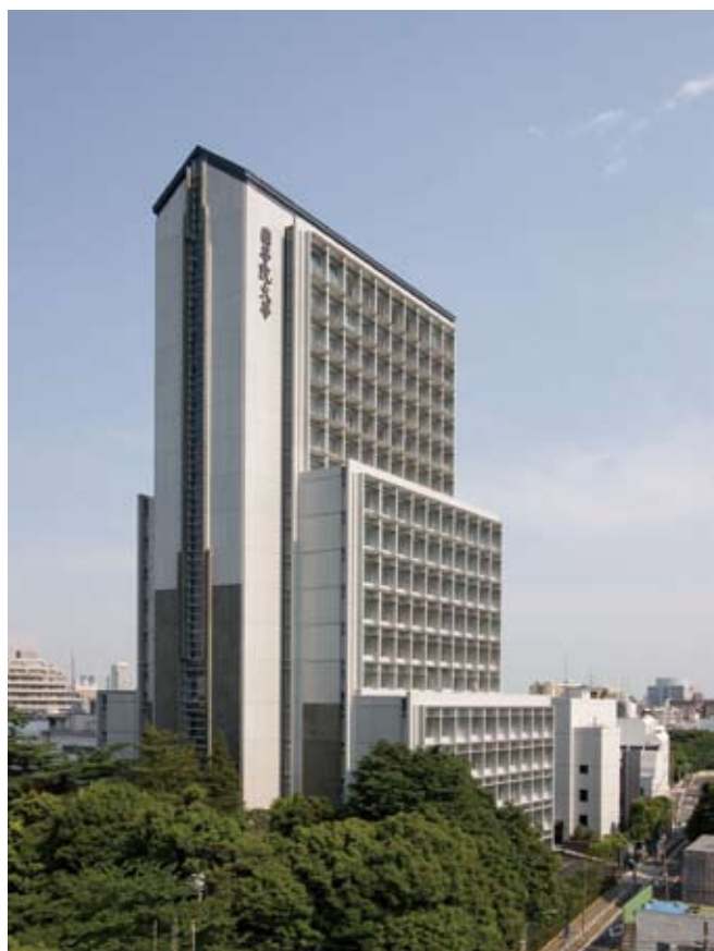
國學院大学若木タワー 設計監理：日建設計 施工：鹿島・大成JV