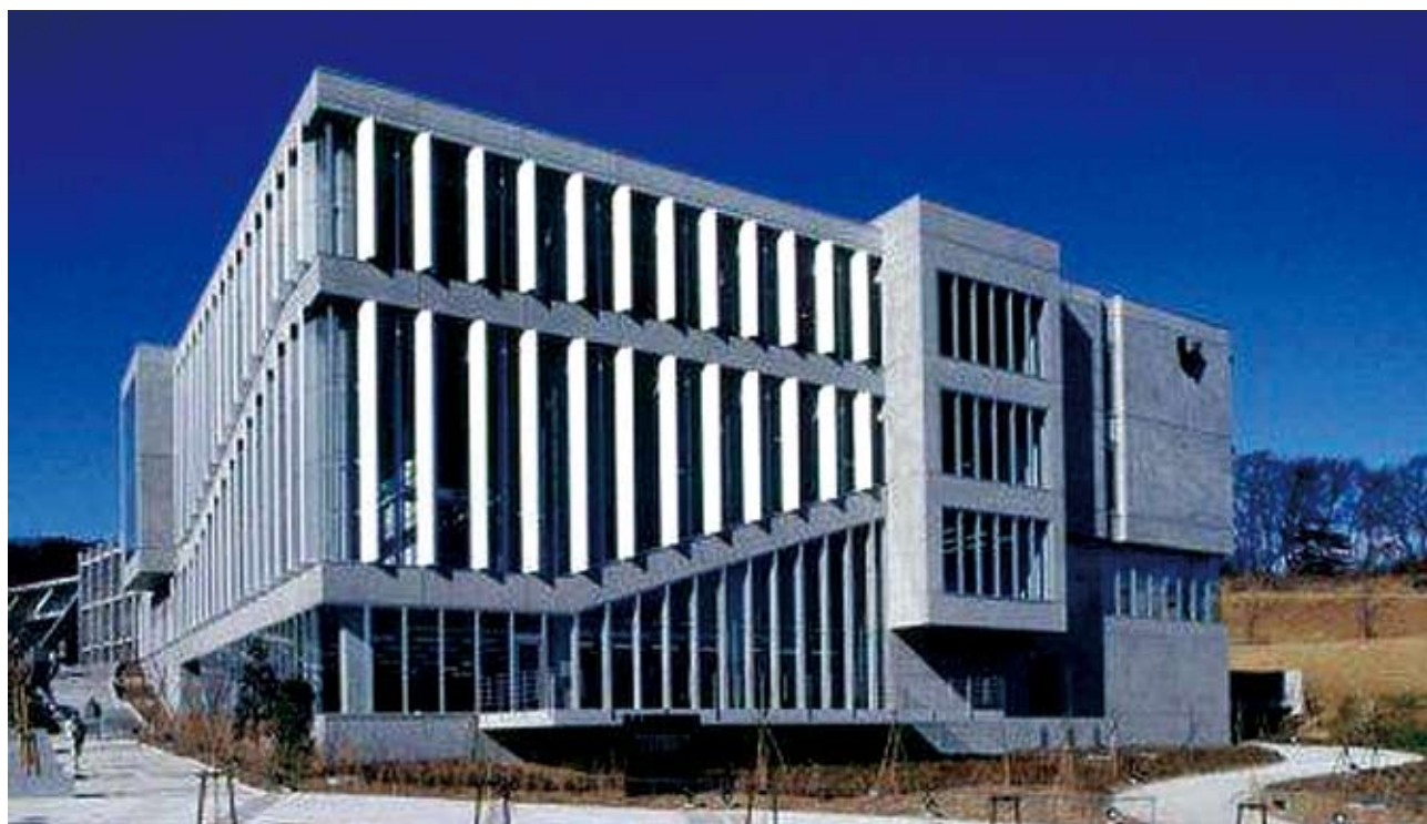
早稲田リサーチパーク・コミュニケーションセンター 設計監理：山下設計 施工：大成建設