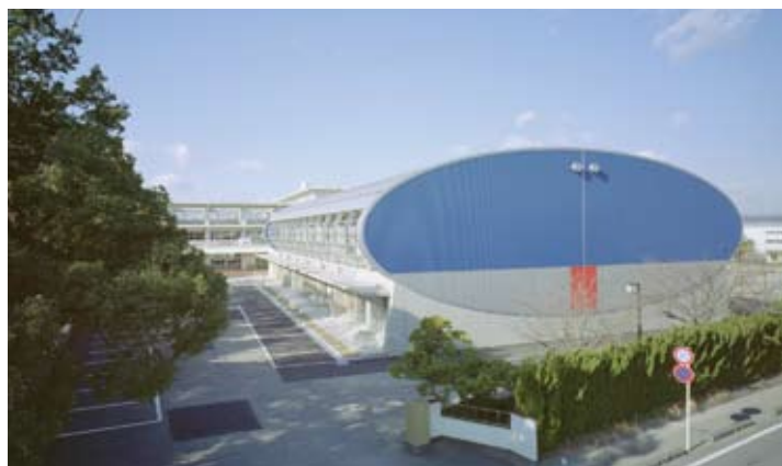
吉田町立住吉小学校屋内運動場 設計監理：佐藤総合計画 施工：飛鳥建設