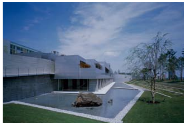
CSK多摩センター 設計監理：シエマアーキテツク 施工：前田建設工業