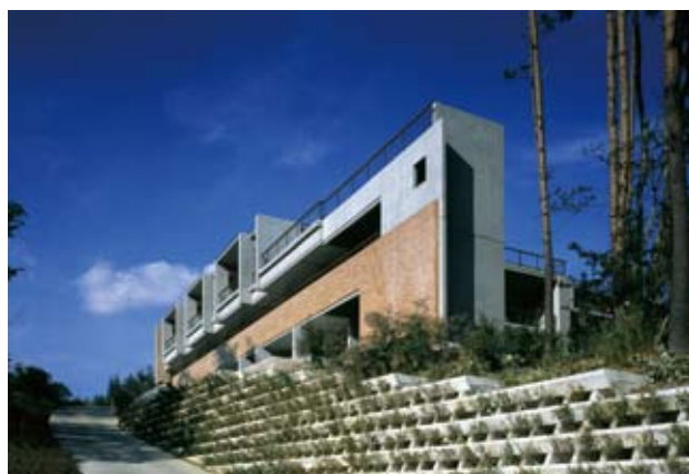
高根町特別養護老人施設みのる荘 設計監理：日建設計 施工：西松建設