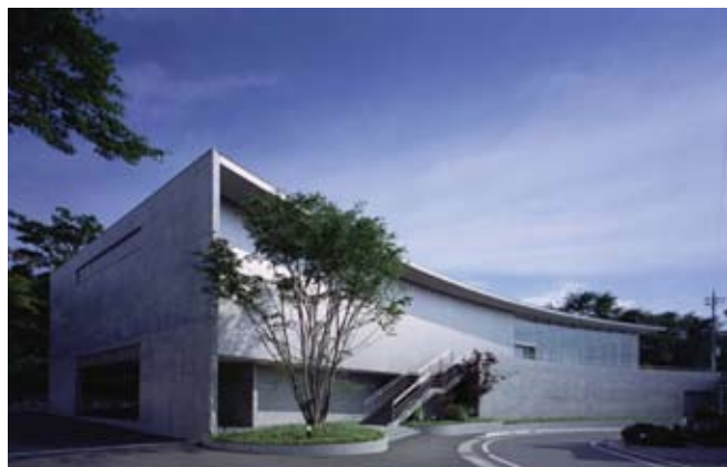
平山郁夫シルクロード美術館 設計施工：水澤工務店