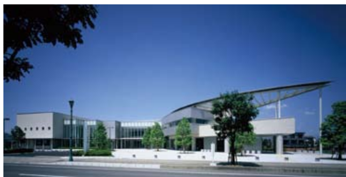
那珂市立図書館 設計監理：桂設計 施工：安藤建設 撮影：SS東京