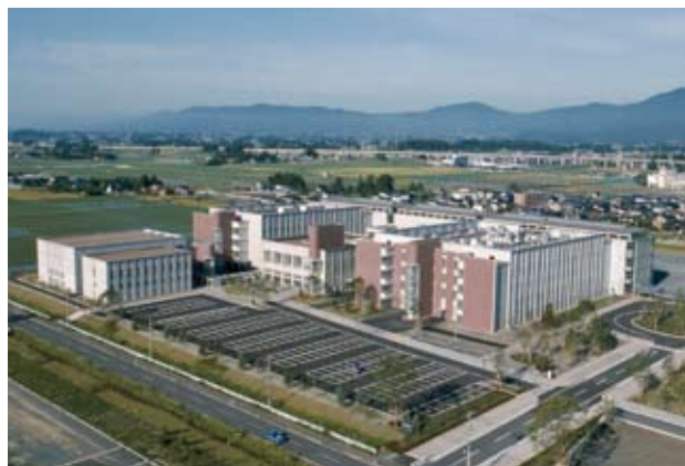
岩手医科大学矢巾キャンパス学部棟 設計監理：日建設計 施工：清水建設