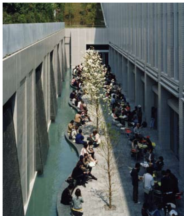
東洋大学白山キャンパス 6号館 設計監理：日建設計 施工：鹿島建設