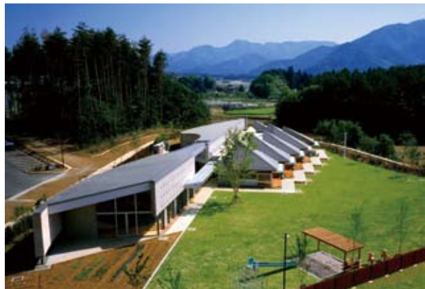
高根町しらかば保育園 設計監理：日建設計 施工：井尻工業