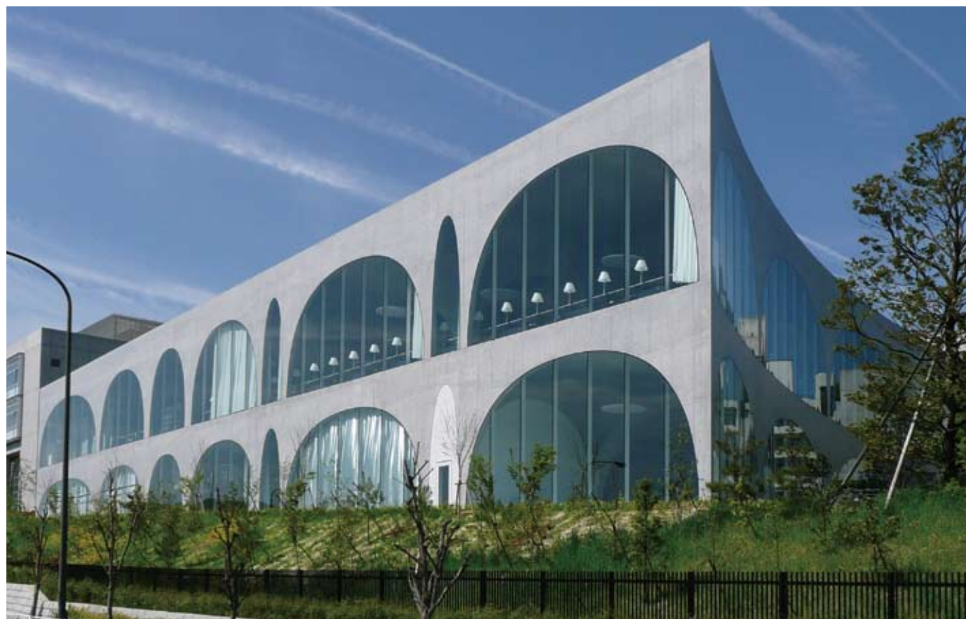
多摩美術大学図書館 設計監理：伊東豊雄建築設計事務所 施工：鹿島建設