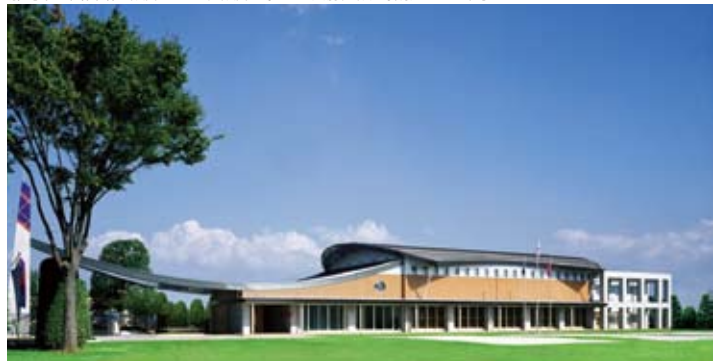
豊島岡女子学園入間総合グラウンド 設計監理：協立建築設計事務所 施工：大成建設 撮影：SS東京