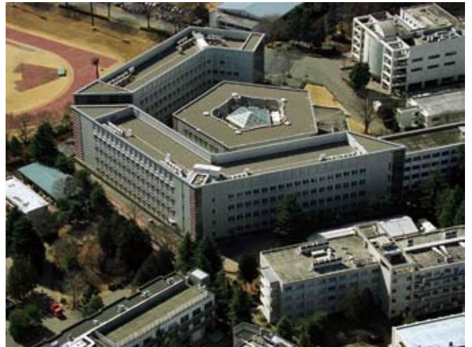
東洋大学川越キャンパス新1号館・図書館 設計監理：日建設計 施工：清水・三井住友JV

ポルトガードは、水性シリコン塗料に「水性反応硬化技術」を応用した高耐候性シリコン塗料です。従来の塗料とは異なり、塗料の状態を保ったまま、水性シリコン樹脂と反応剤が均一に混じり合い、しかも液体としての安定性があります。塗付後の水蒸発により、反応硬化が始まり、水性化シリコン樹脂が相互に結合され、樹脂の粒子間の反応硬化によって、三次元構造の強力な塗膜が形成されます。